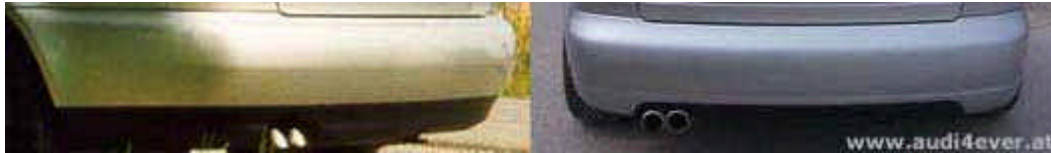
Heckansicht: Links Serie - rechts S4 von Daniel

Ich glaube es ist überflüssig das hier genauer zu erläutern da ich Euch ja wohl schwer die Positionen der Schrauben nennen kann *g*