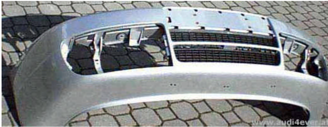
Die S4-Stoßstange im Rohzustand (naja, schon lackiert ;-)

Während die Teile beim Lackierer trocknen wird schon mal die Serien-Stoßstange abgebaut. Wer Nebelscheinwerfer in der Stoßstange integriert hat muss diese vorerst ausbauen, abschließen und beiseite legen. Gleiches gilt für die Hauptscheinwerfer.